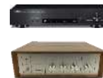
アンプ CDプレー ヤー