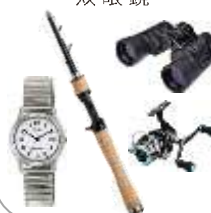
腕時計 釣り具 双眼鏡