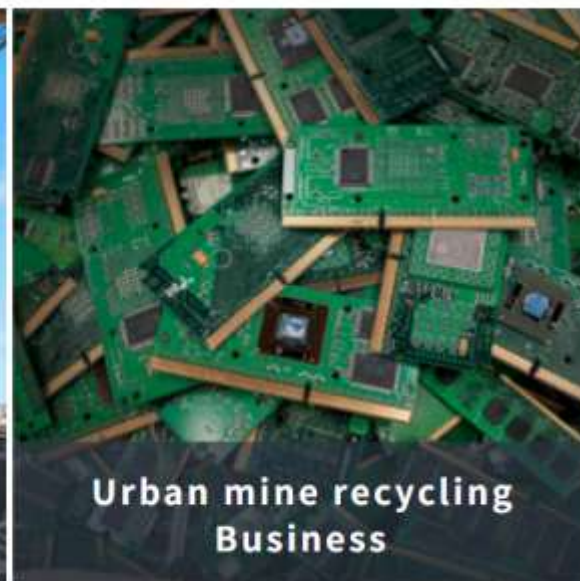
都市鉱山リサイクル事業