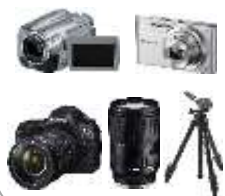
デジタル カメラ ビデオ