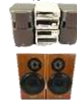
コンプ スピー カー