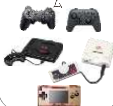
ゲーム機 周辺機器 旧型ゲー ム