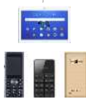
携帯電話 タブレッ ト