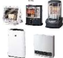
ストーブ 空気清浄 機