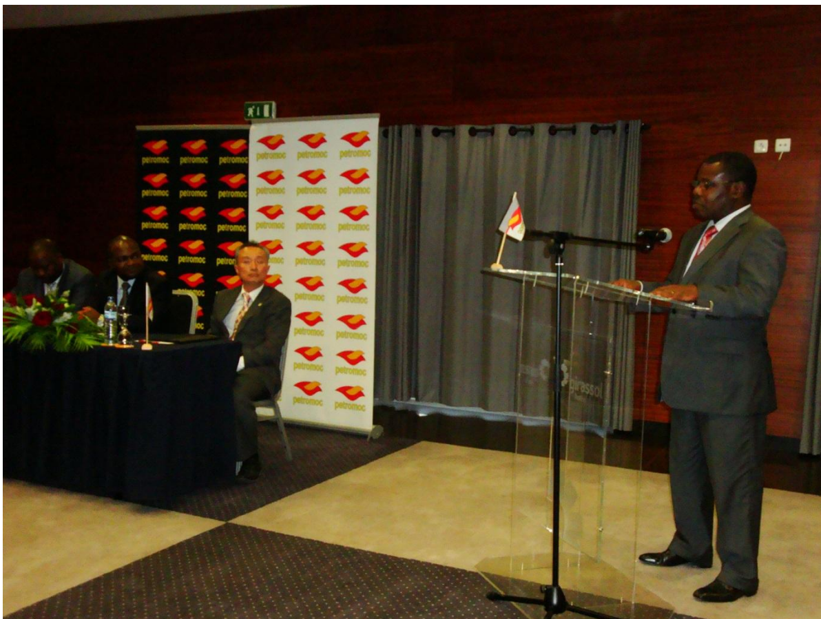
ナンブレッテ エネルギー大臣 挨拶