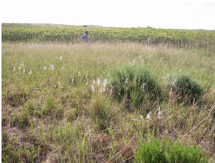
ジャトロファ農園視察 (Maputo 州 Bilene 地区)