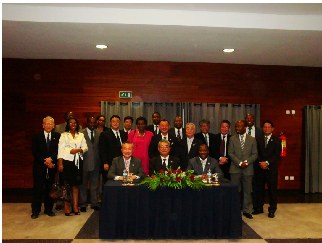
設立調印式 列席者