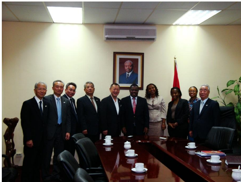
サルバドール ナンブレッテ エネルギー大臣 表敬